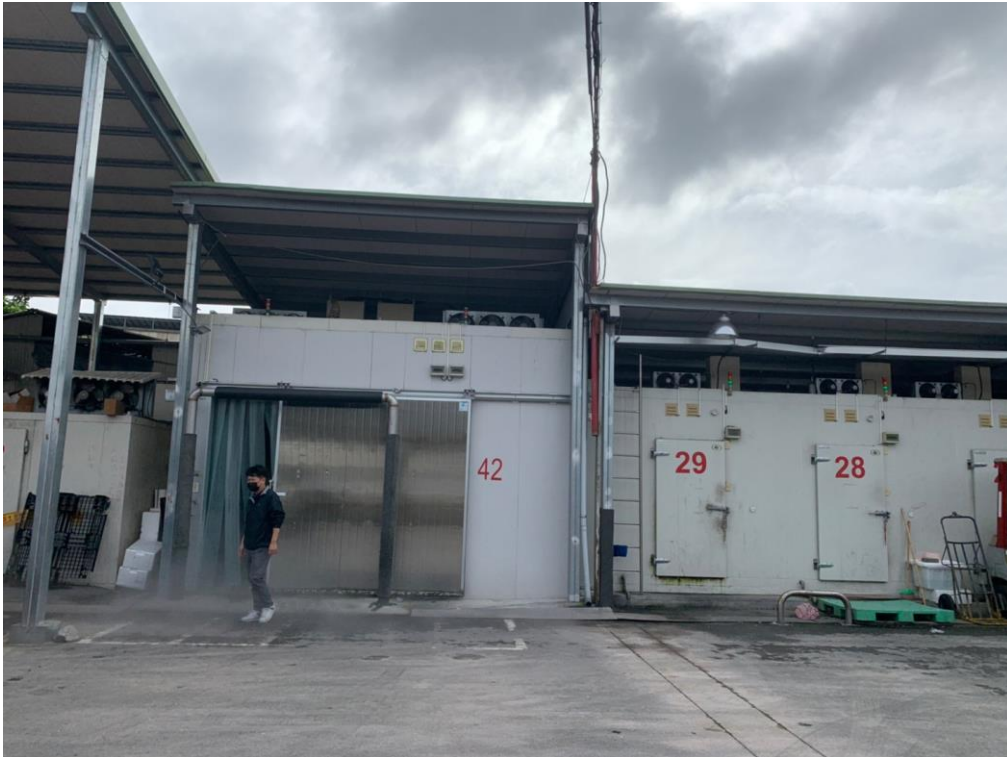
漁會貨品存放冰庫