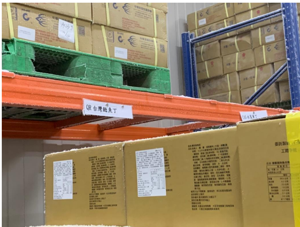
各類貨品分類存放