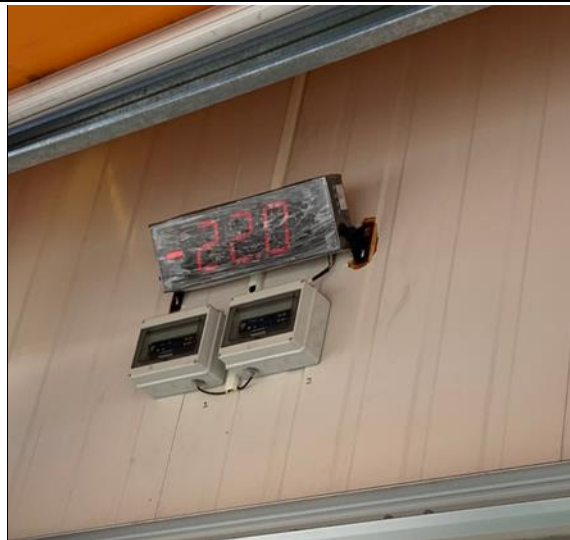
凍庫保存溫度-18 度以下