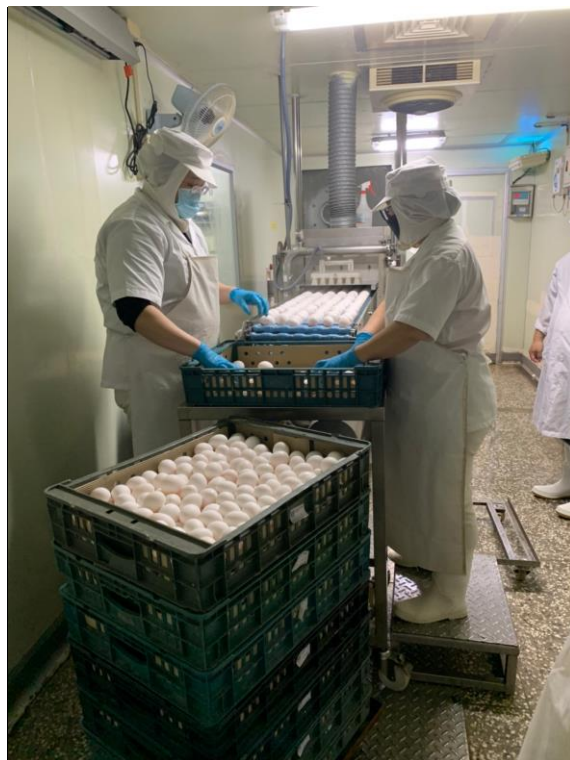
籃蛋排列進入軌道清洗 當日本區有蚊蟲