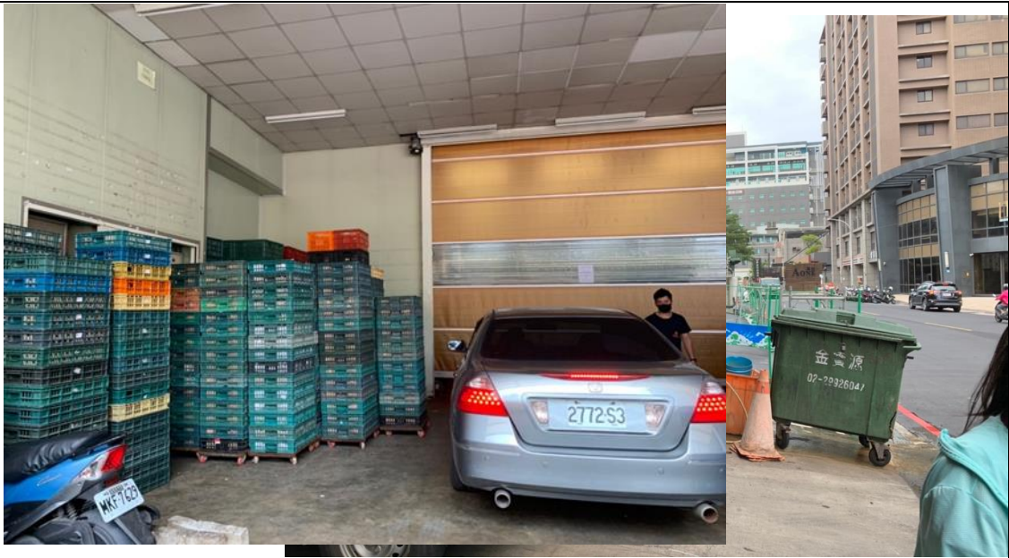
門外籃蛋存放區 與車輛及垃圾回收並存