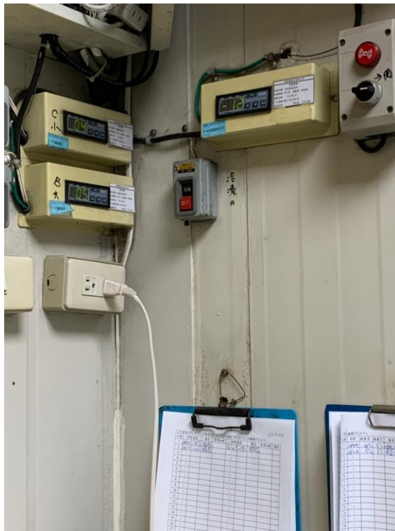
存冰箱溫度有達規範