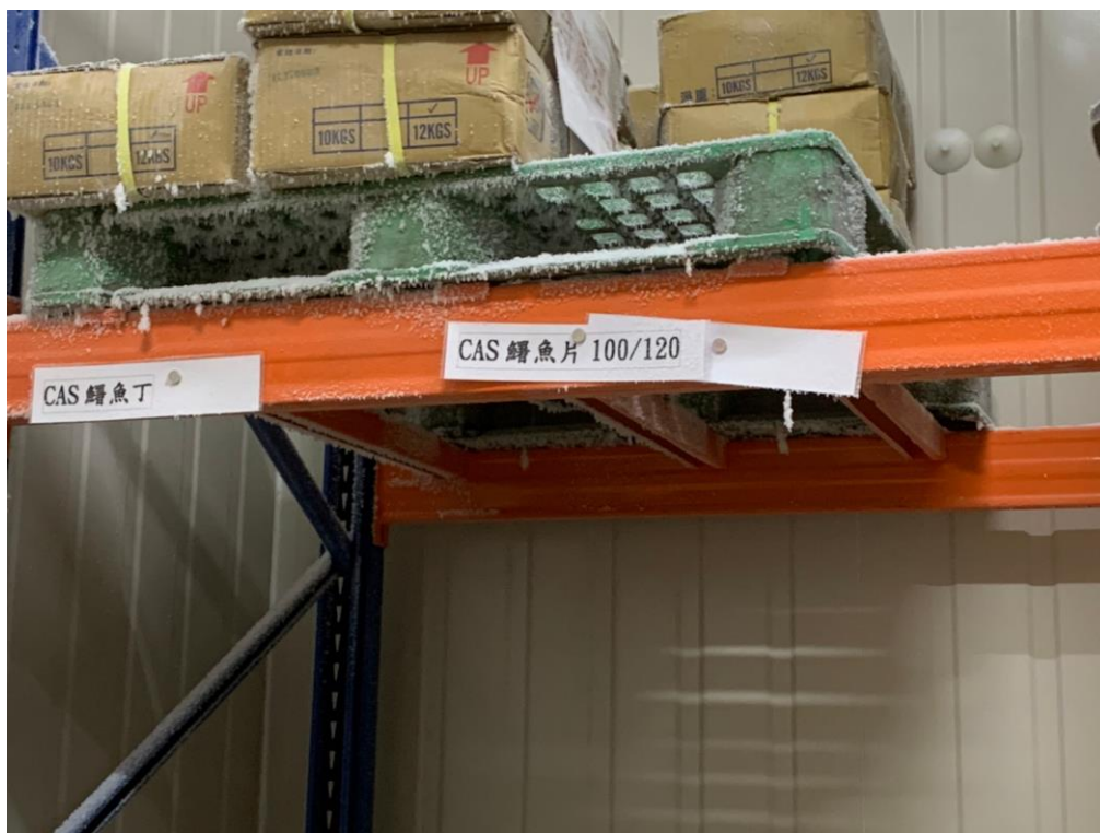
各類貨品分類存放